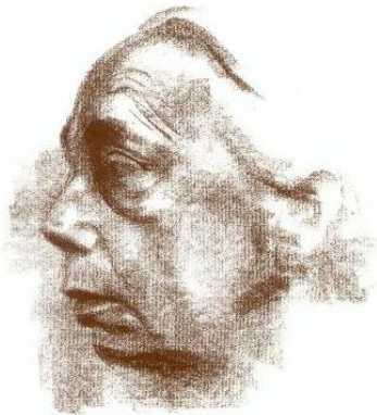
Käthe Kollwitz 1867 – 1945

„Käthe Kollwitz wollte wirken, nicht um des Erfolges willen, sondern aus innerer Notwendigkeit heraus und um einzugreifen in ihre Zeit; sie wollte nicht dürres Blatt am absterbenden Baum sein.“